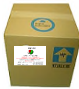
20L インボックス (200ppm)