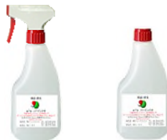
500ml 50ppm ガンスプレー・替えボトル