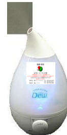
超音波噴霧加湿器 (タンク容量3.3L 有効範囲 50m)