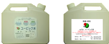
2L ボトル (200ppm・50ppm (左右画像))